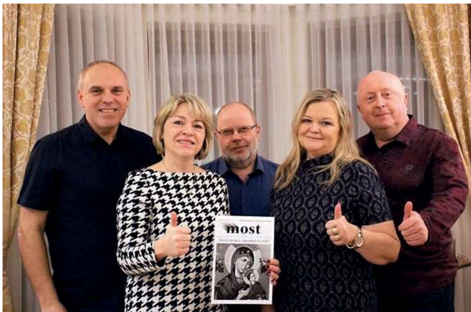
Celé redakci přejeme hojnost Božího požehnání a odhodlání k další práci nejen ve prospěch třineckých farníků, ale všech, ke kterým se MOST dostane.

Při listování některými staršími čísly se dočteme třeba o farních poutních zájezdech, o nejrůznějších farních akcích, lze