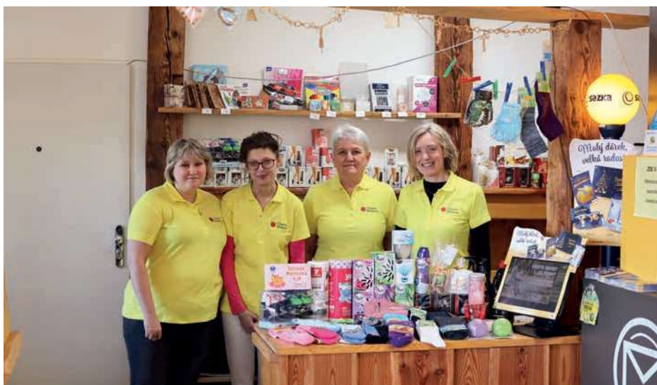
Na poště v Polance nad Odrou se dají poříditi i produkty chráněných dílen.